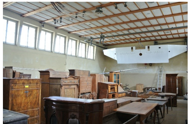
Abbildung 4: Innenansicht ehemalige Turnhalle