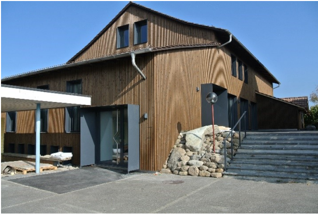
Abbildung 1: Aussenansicht neue Fassade Buechwäidsaal