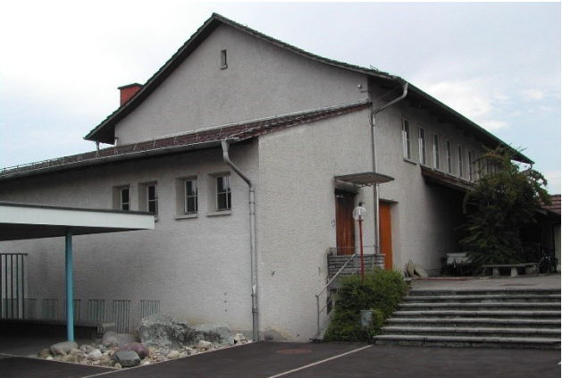
Abbildung 3: Aussenansicht alte Fassade