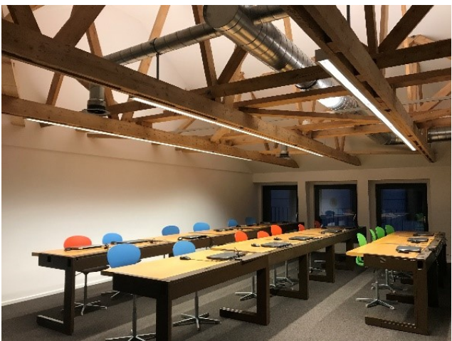
Abbildung 5: Neuer Medienraum 1. OG