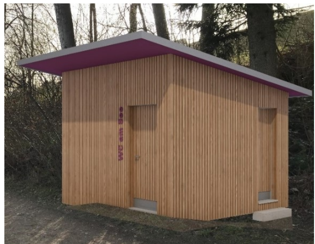
Abbildung 7: Fotomontage Aussenansicht.

Das Projekt sieht vor, ein WC-Häuschen mit behindertengerechter Toilette und kleinem Service-raum zwischen den beiden Erholungszonen Bootssteg (200m) und Badi (100m) zu erstellen. Wasser-, Abwasser- und Stromanschlüsse werden mittels Bohrverfahren vom bestehenden Pumpwerk „See“ geführt. Dieses Verfahren und die dadurch mögliche Leitungsführung haben den Vorteil, dass nur geringe Bodeneingriffe nötig sind (Baugruben für Bohrvorrichtungen), keine Wiederherstellungskosten anfallen und die Beeinträchtigungen der Erholungssuchenden am See minimal sein werden.