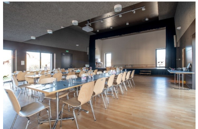
Abbildung 2: Innenansicht Bauchwäidsaal