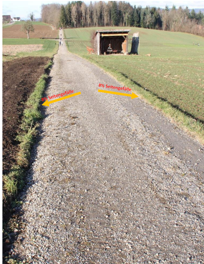
Wasser muss schnellstmöglich von der Fahrbahn